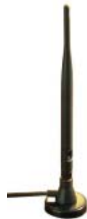
5dBi jelerősségű antenna az állványon